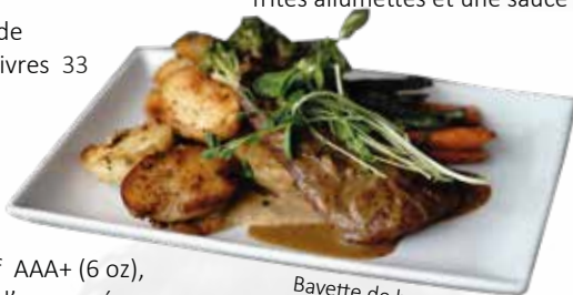
Bavette de boeuf AAA+

Tendre steak AAA de 9oz, servi avec des frites allumettes et une sauce aux poivres 43