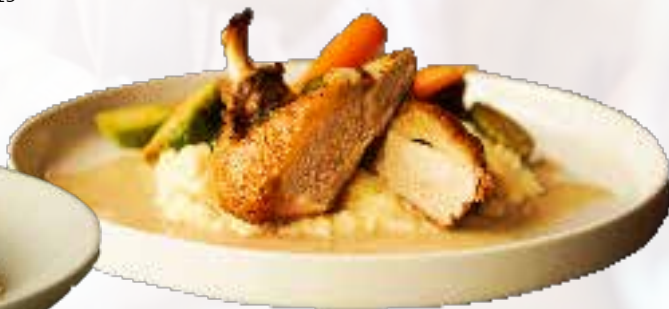
Suprême de pintade

Suprême de pintade de la Pintade (Princeville) grillé à point, accompagné d'un risotto au cheddar, de légumes du moment et d'une sauce aux champignons 28