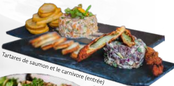
Tartares de saumon et le carnivore (entrée)

Boeuf, oignons rouges, câpres, noisettes, mayonnaise épicée, ciboulette, persil, huile de noisettes et vinaigre de xérès 17