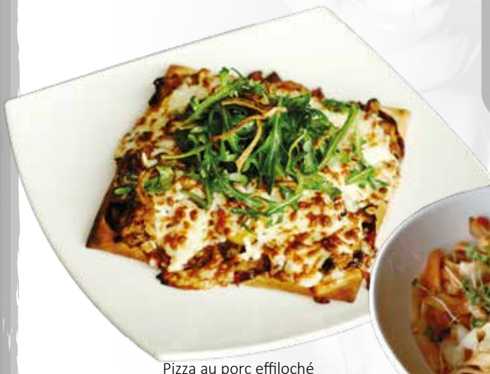
Pizza au porc effiloché