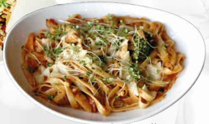
Fettucine aux légumes