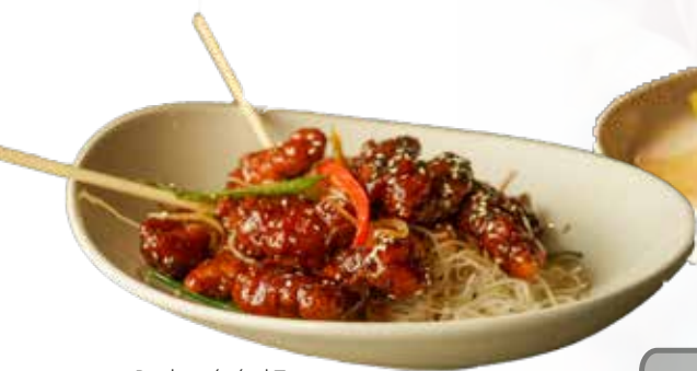
Poulet général Tao

Poulet croustillant, pois mange-tout, poivrons de couleur, oignons espagnols, sauce général Tao et graines de sésame, servi sur vermicelles 19