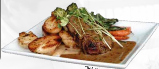
Filet mignon AAA

Filet mignon de boeuf AAA (7 oz), accompagné d'une purée d'oignons doux, d'une poêlée de pommes de terre grelots, légumes du moment et d'une sauce aux poivres 45